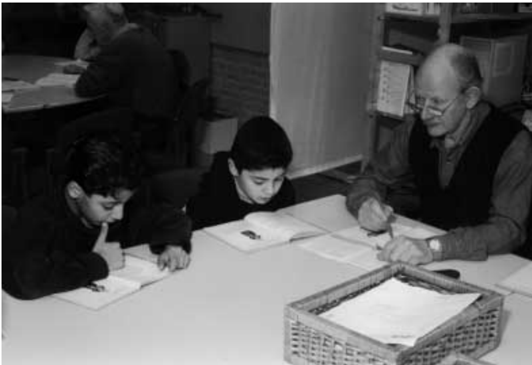
Een nieuwe bron van capaciteiten

zelf geen kleinkinderen hebben houden desgewenst op deze manier contact met jongere generaties. Nieuwe contacten leggen zij niet alleen met de jeugd; ook met de ouders en de onderwijzers kunnen zij het goed vinden. Zij ontleen een zekere status aan het werk en voelen zich meer dan voorheen opgenomen in het maatschappelijk leven. Op hun beurt beschouwen de leerkrachten de senioren als belangrijke medewerkers en zelfs ambassadeurs van de school, die met gepaste trots bij andere buurtbewoners reclame maken voor 'hun' school. De leerkrachten betrekken de ouderen ook bij andere activiteiten, zoals de kerstviering of de jaarlijkse musical. 'Ze horen erbij', zegt een leerkracht. Overigens ervaren de senioren ook het contact met de eigen leeftijdsgenoten, bijvoorbeeld tijdens het koffiedrinken, als waardevol. Daar komen niet alleen de schoolse zaken aan de orde, maar worden ook meer persoonlijke zaken besproken. De ervaringen in Almelo wijzen uit dat het project alleen duurzaam succes heeft als de school iemand gedurende een noodzakelijk aantal uren vrijmaakt voor het inwerken en begeleiden van de vrijwilligers. Zo'n begeleider moet ook aandacht besteden aan de persoonlijke mogelijkheden van de individuele vrijwilligers, zodat iedereen zo goed mogelijk tot zijn recht komt. Zoals in het Haagse voor-